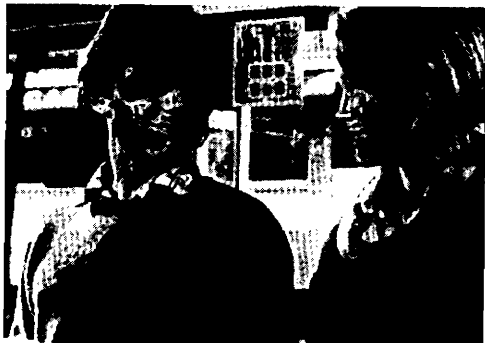
Les doigts dans la tête